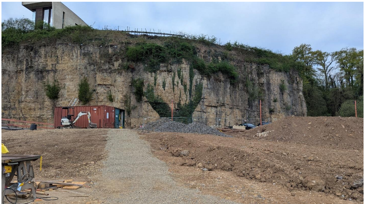
Figure 6 Travaux de terrassement sur les parcelles de la ZPS III.