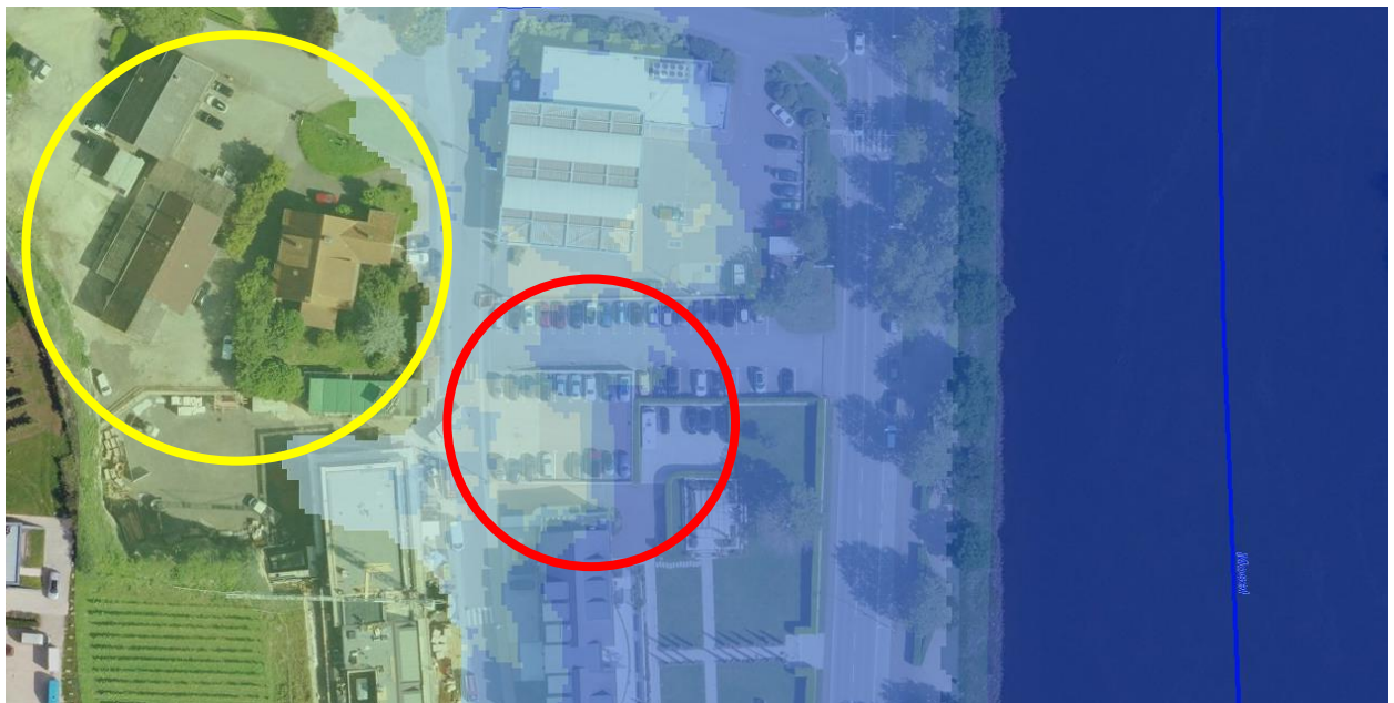
Figure 2 En rouge la parcelle 224/3026 RD de Schengen qui se situe dans la ZPS III et dans le HQ100. En jaune les parcelles qui se situent dans la ZPS III.