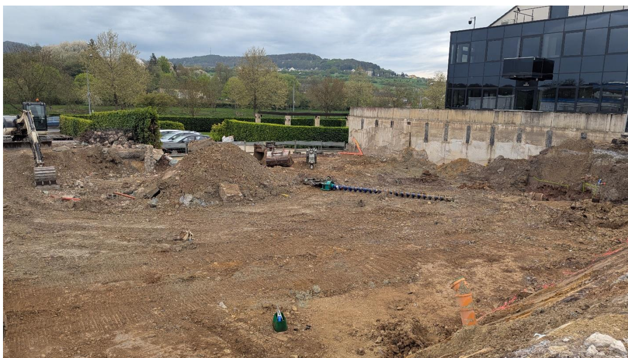
Figure 4 Terrassement des terres polluées sur la parcelle 224/3026 RD de Schengen.