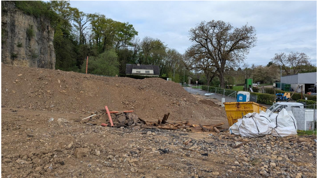
Figure 5 Travaux de terrassement sur les parcelles de la ZPS III.