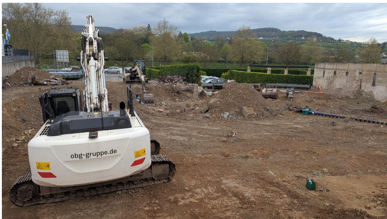
Figure 3 Terrassement des terres polluées sur la parcelle 224/3026 RD de Schengen.