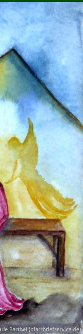
arie Barthel (pfarrbriefservice.de)

möchte von dir noch die Antwort haben, die du deiner Mutter gegeben hast, als sie dich fragte, wieso denn der Milchbecher zerbrechen konnte.“